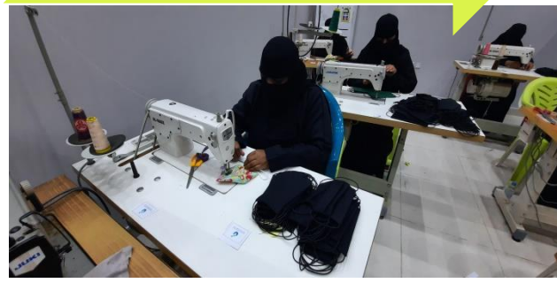
ورش التدريب على صناعة الكمامات